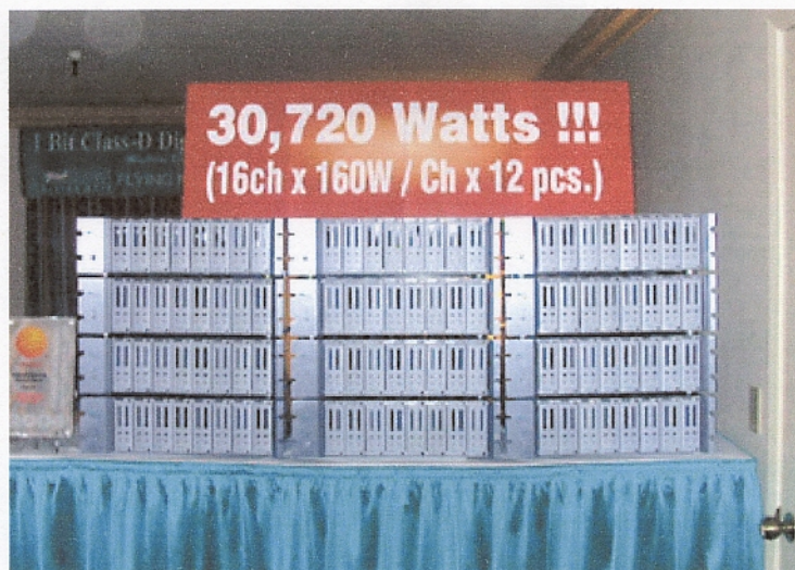
「DPA-M1616 Cascade」を12台接続した様子