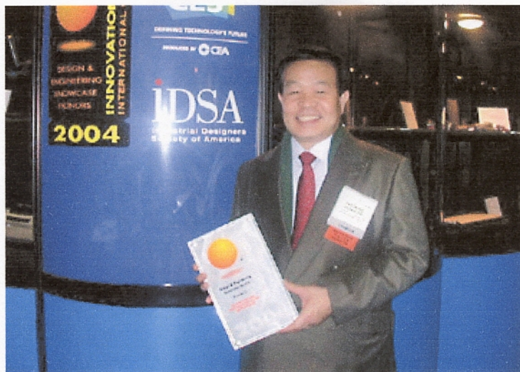
レセプション会場での笹原社長